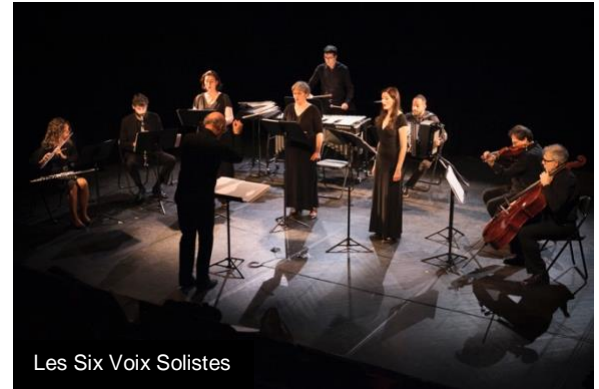
Les Six Voix Solistes

Résonance Contemporaine est une structure au service de la création et des pratiques artistiques. Association créée en 1987, elle est administrée par des membres bénévoles qui partagent le projet de défendre la création contemporaine et de favoriser la pratique artistique de chacun. Construite en premier lieu autour de la musique, elle s'est largement ouverte à la diversité des disciplines et à la fécondité de leur croisement.