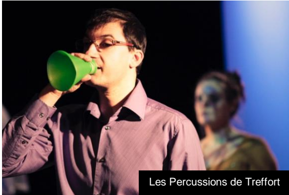
Les Percussions de Treffort