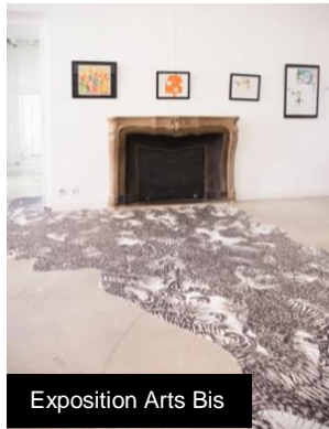
Exposition Arts Bis